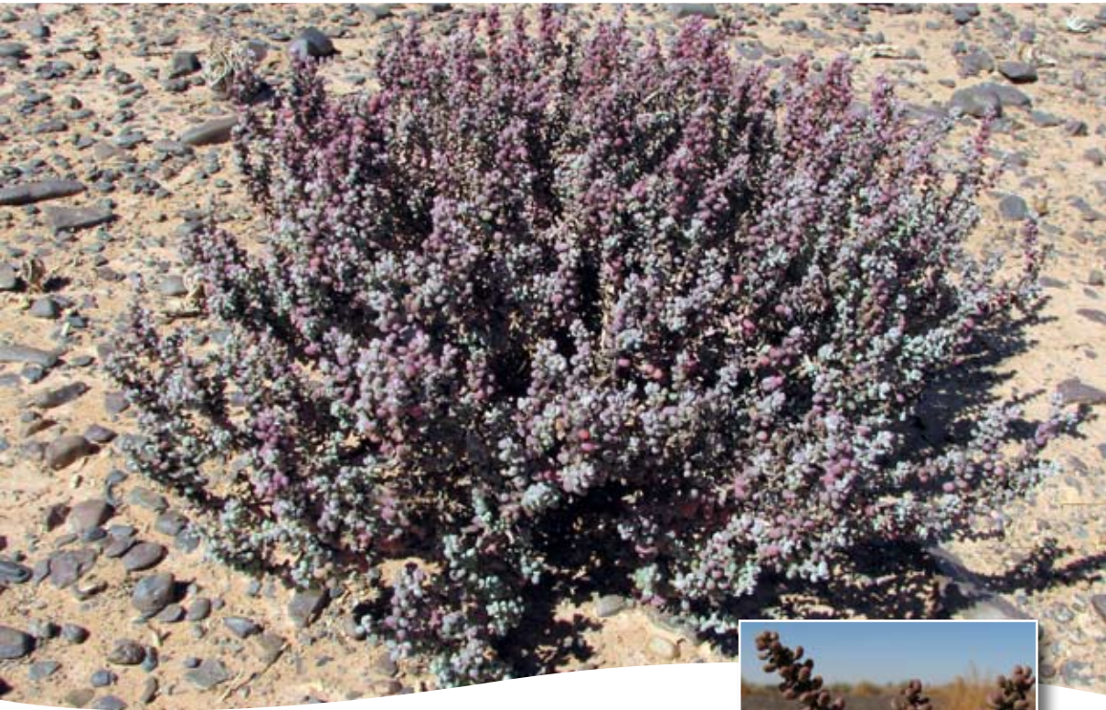
Suaeda vermiculata Forssk. ■