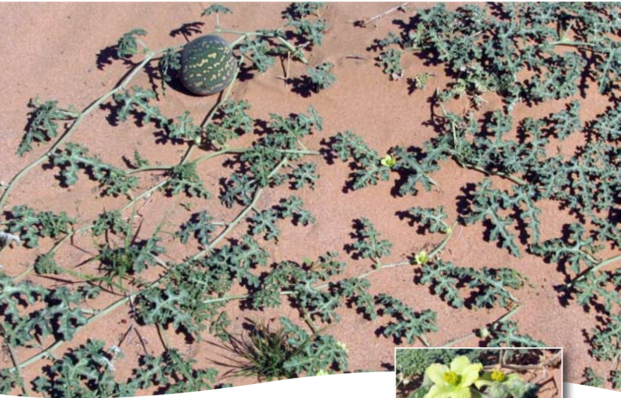
Citrullus colocynthis (L.) Schrad. ■