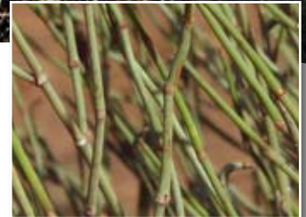
Ephedra alata Decne. ■