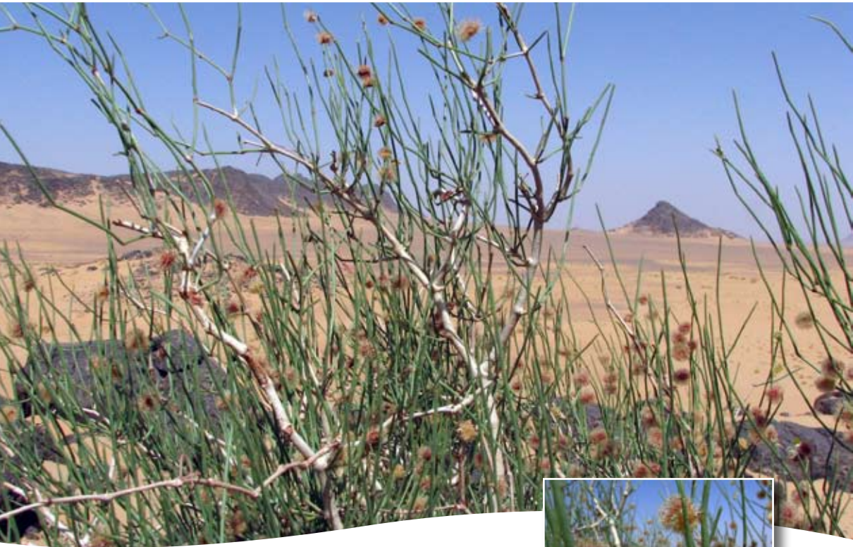
Calligonum comosum L'Hér. ■