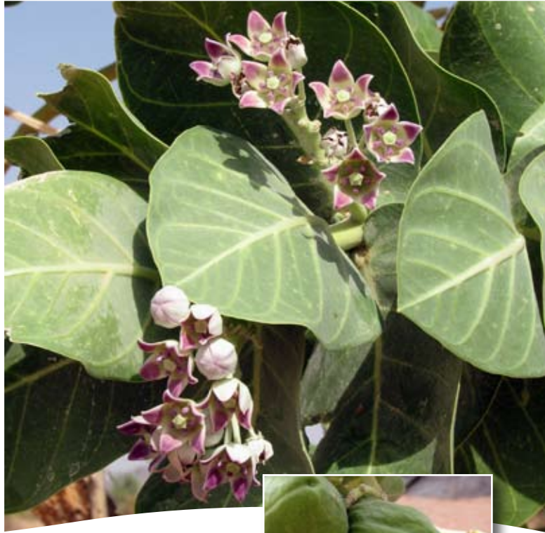
Calotropis procera (Ait.) Ait. f. ■ subsp. procera