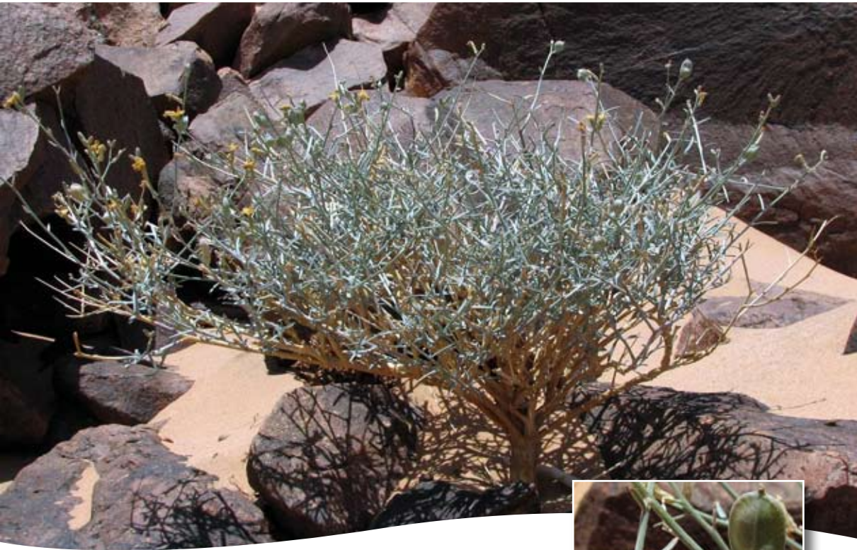
Farsetia aegyptia Turra ■