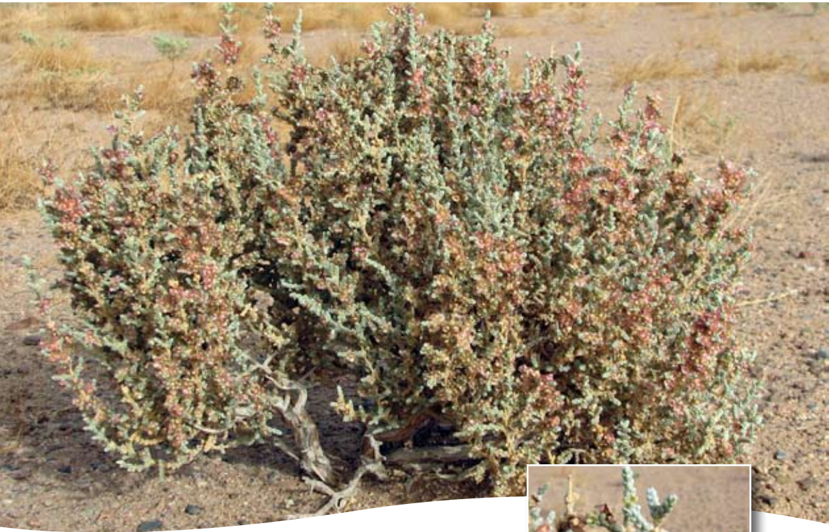
Salsola tetragona Del. ■