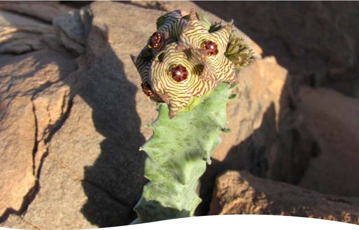
Caralluma sp. ■