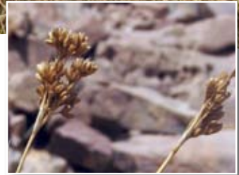
Juncus rigidus Desf. ■ (= J. maritimus auct. non Lam.)