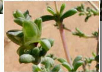
Nucularia perrini Batt. ■