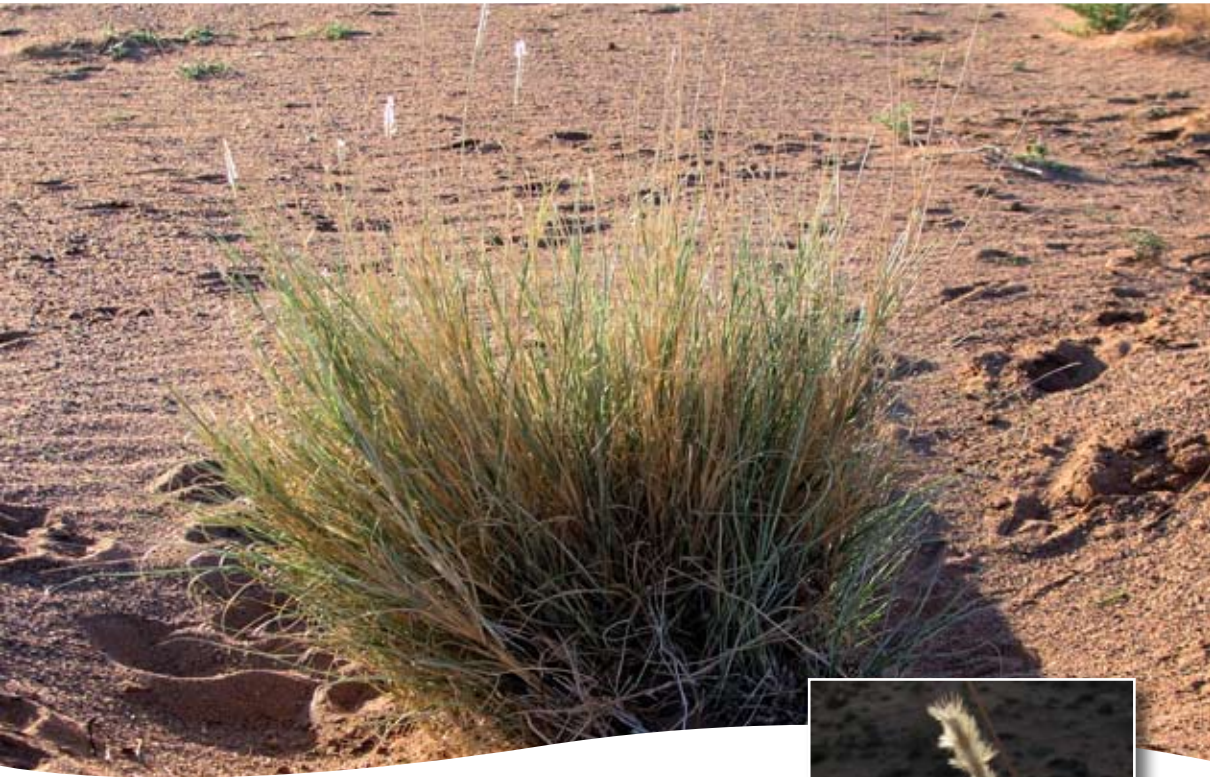
Lasiurus scindicus Henrard ■ (= L. hirsutus (Vahl) Boiss.)