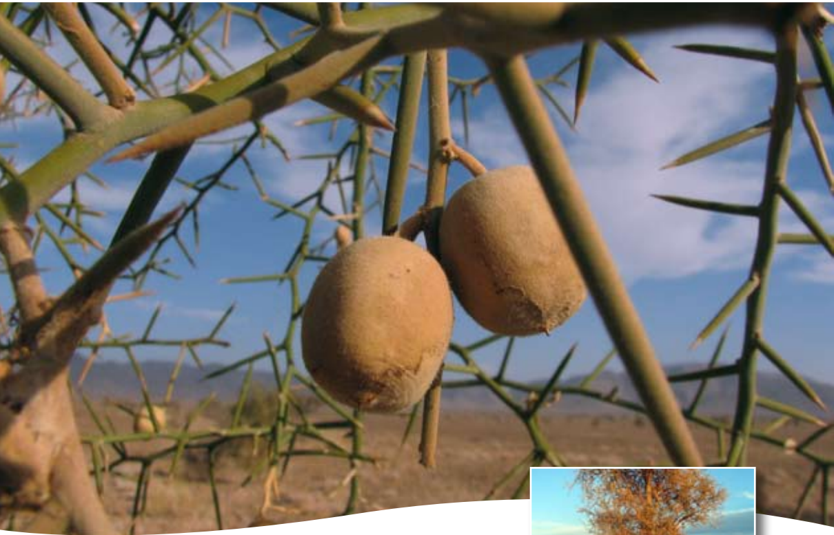
Balanites aegyptiaca (L.) Del. ■