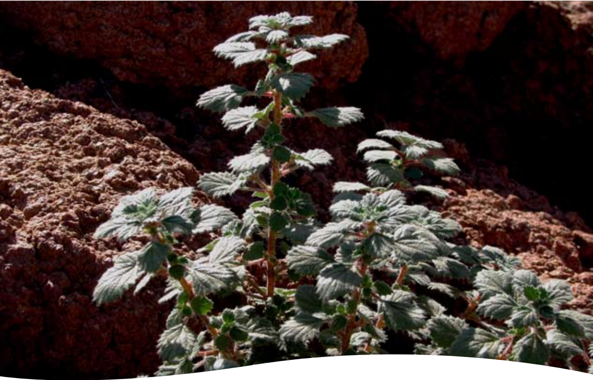
Forsskalea tenacissima L. ■