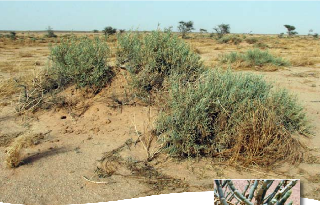
Anabasis articulata (Forssk.) Moq. ■