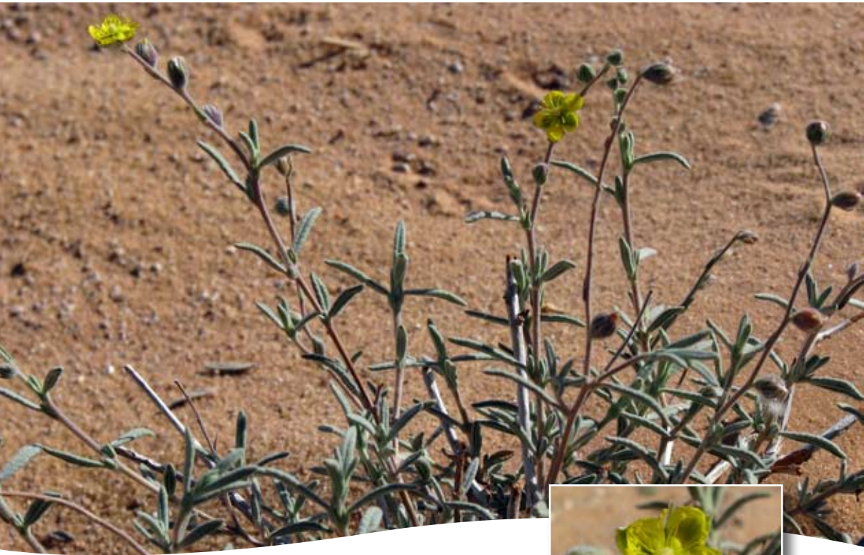
Helianthemum lippii. (L.) Pers ■