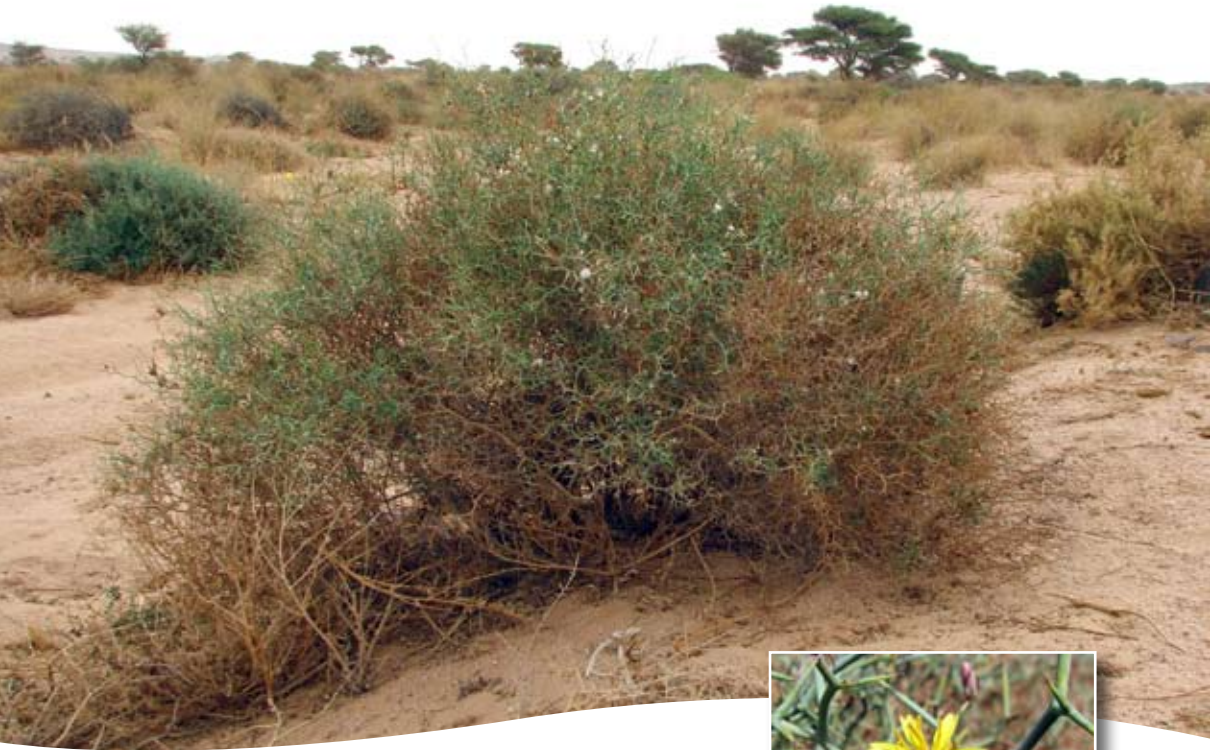
Launea arborescens (Batt.) Maire ■