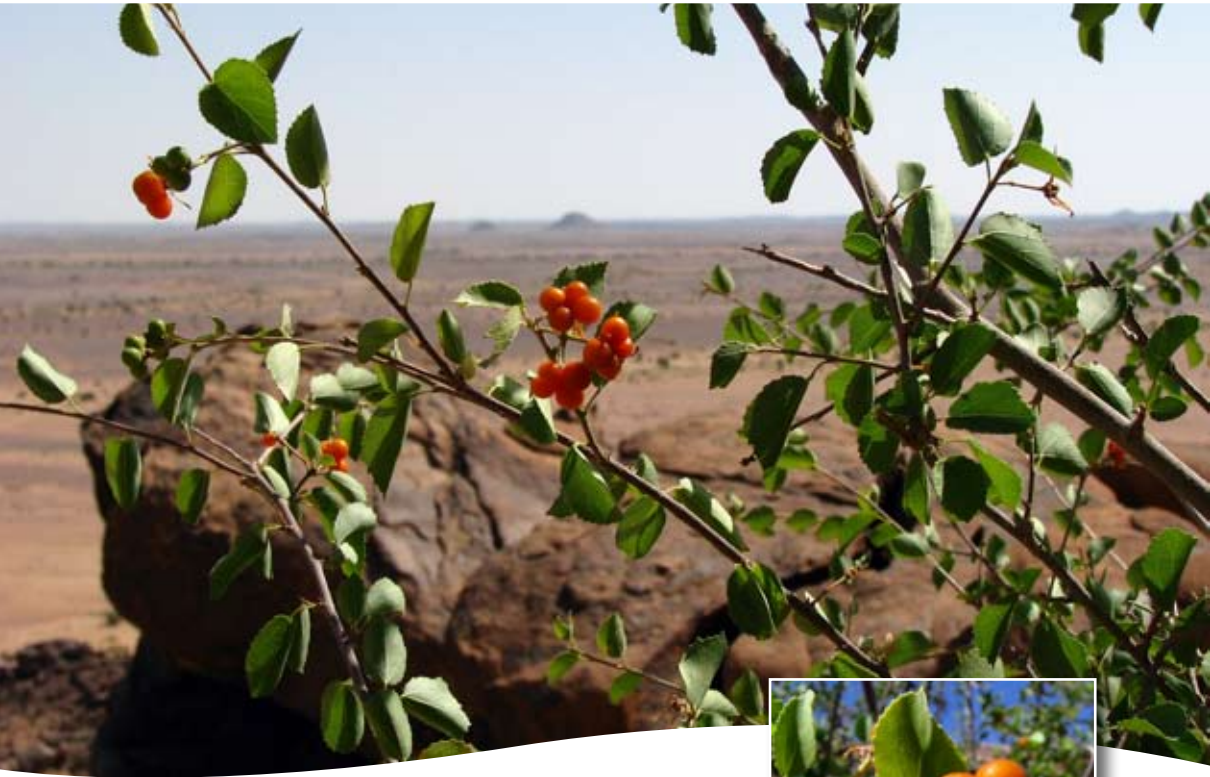
Grewia tenax (Forssk.) Fiori ■