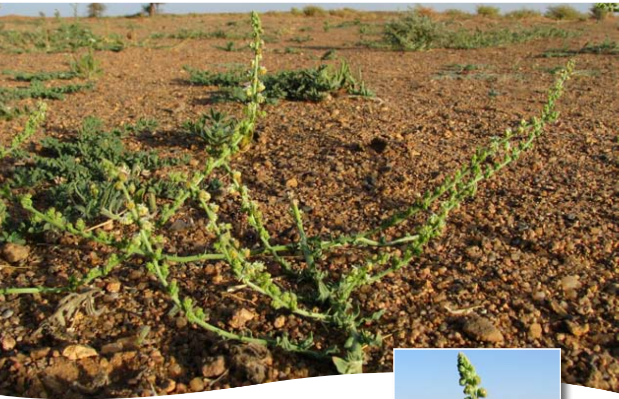
Caylusea hexagyna (Forssk.) M.L. Green ■