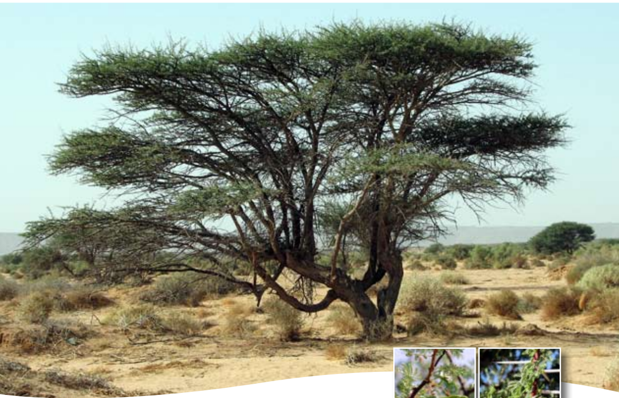
Acacia tortilis ■ subsp. raddiana (Savi) Brenan.