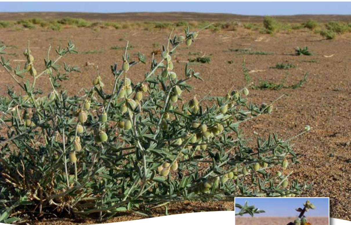
Crotalaria saharae Coss. ■