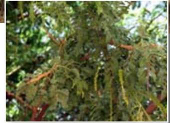
Faidherbia albida (Del.) A. Rich. ■ (= Acacia albida Del.)