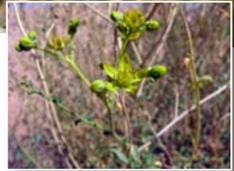
Ruta tuberculata Forsk. ■ (= Haplophyllum tuberculatum Juss.)