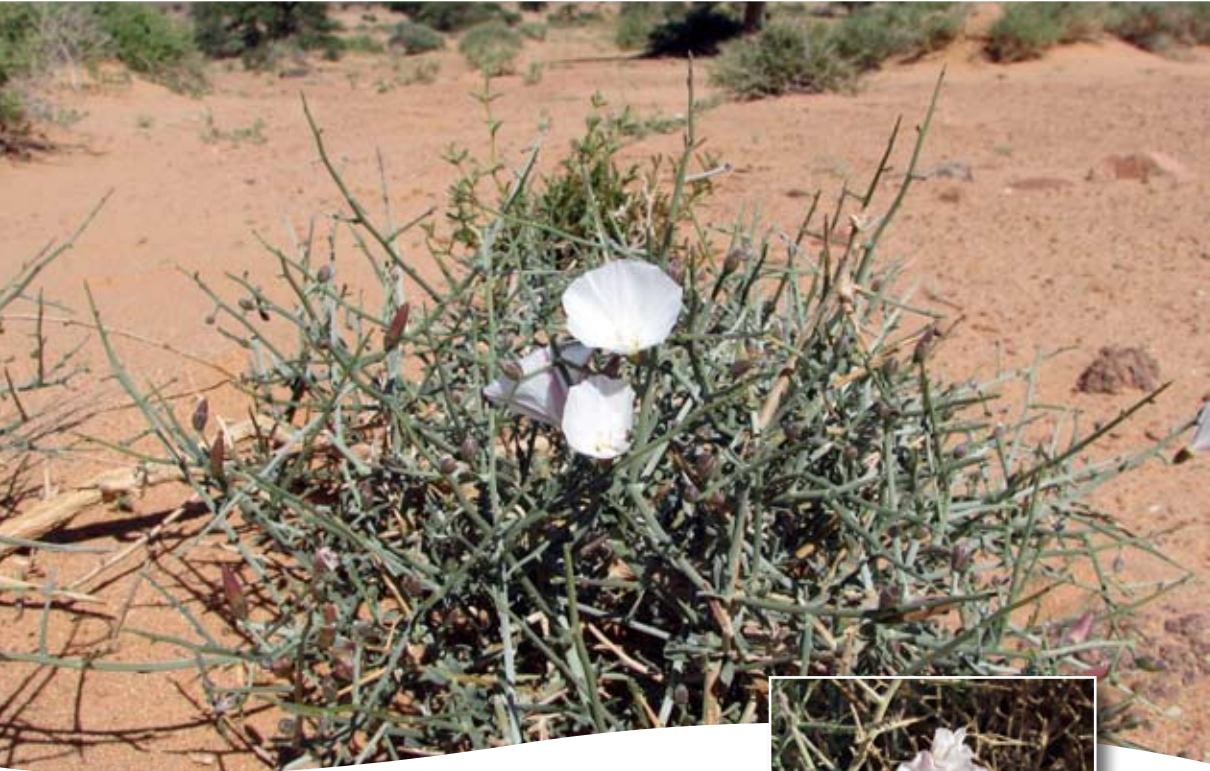
Convolvulus trautmanianus Schw. et Musch. ■