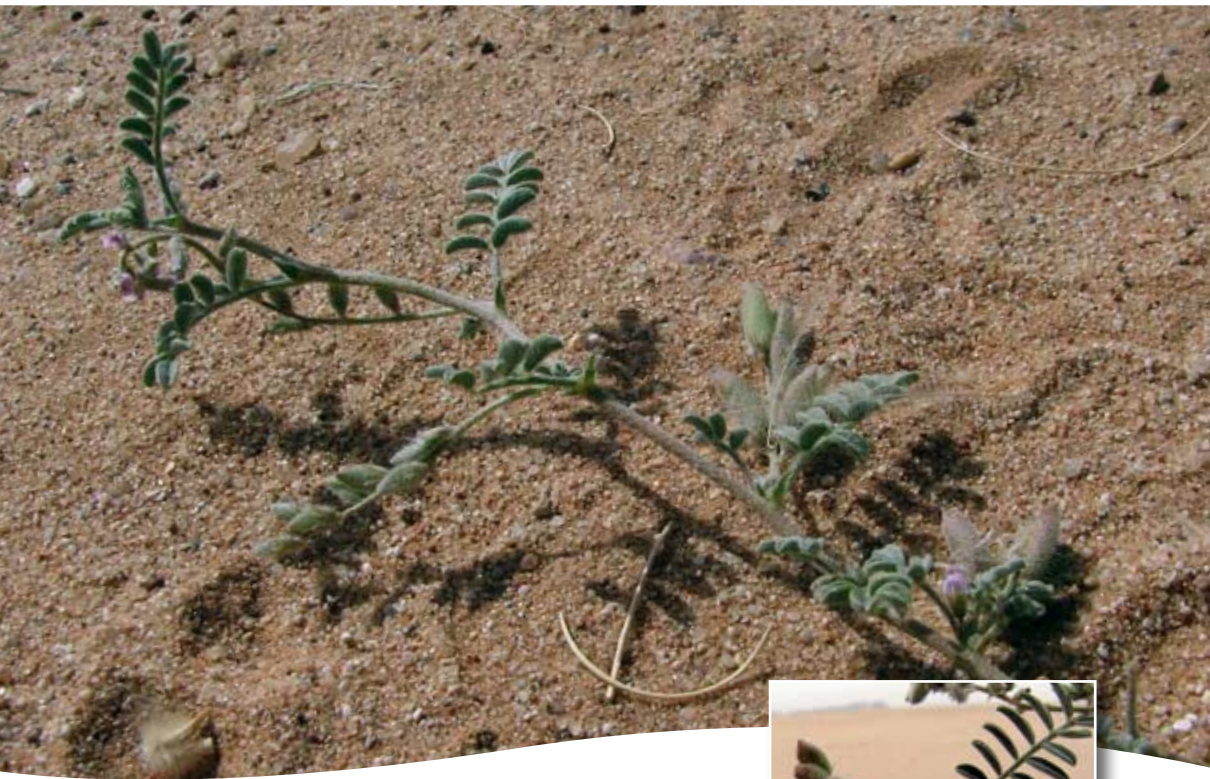
Astragalus vogelii (Webb) Bornm. ■