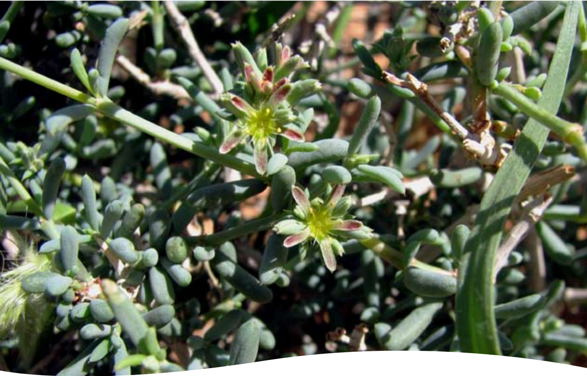
Gymnocarpus decandrus Forssk. ■