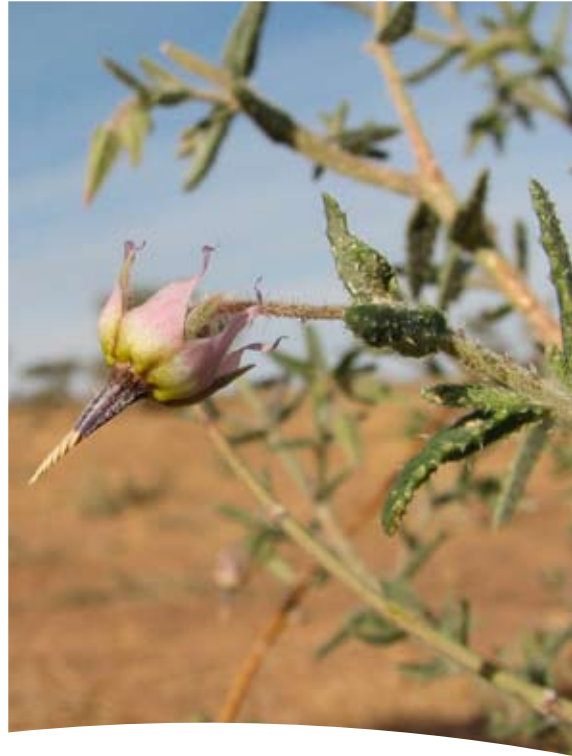
Echium horridum Batt. ■ Trichodesma calcaratum Coss.