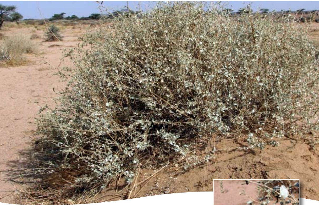
Atriplex halimus L. ■