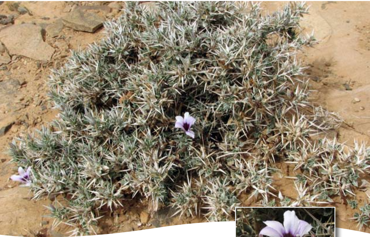
Barleria schmittii Benoist ■