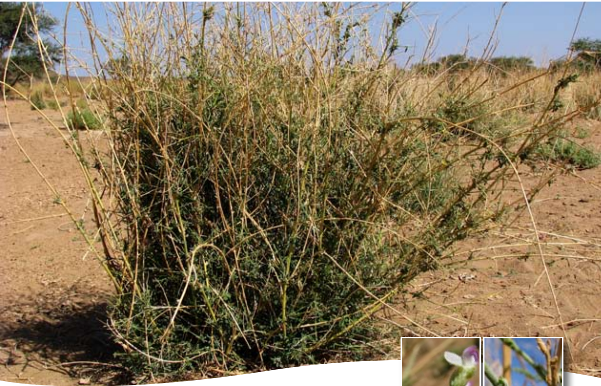
Psoralea plicata Del. ■