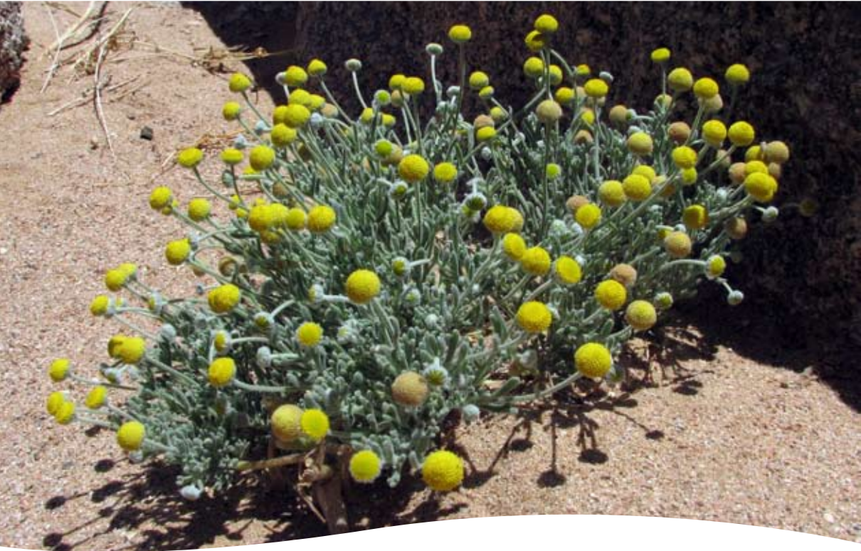
Cotula cinerea Del. ■ (= Brocchia cinerea (Del.) Vis.)