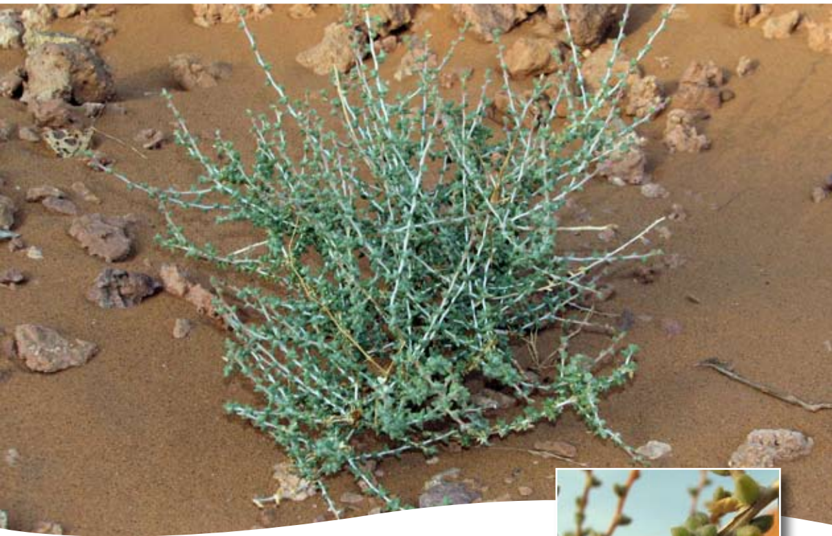
Traganum nudatum Del. ■