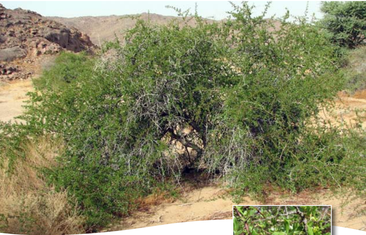
Rhus tripartita (Ucria) Grande ■ (= Rh. oxyacantha auct.)