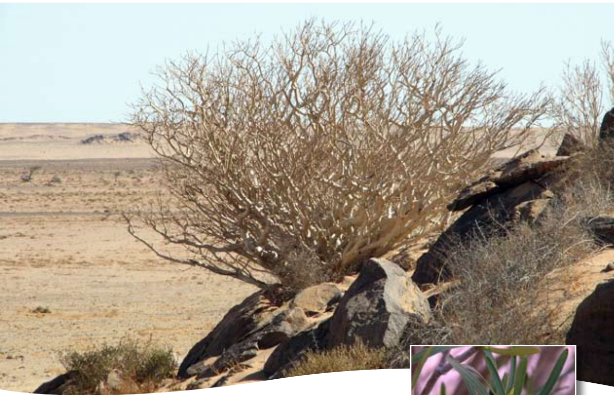
Euphorbia balsamifera Aiton ■