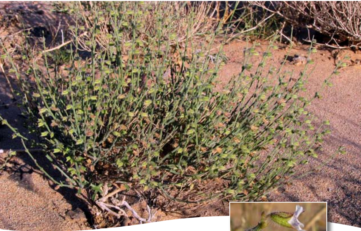
Salvia aegyptiaca L. ■