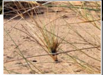
Panicum turgidum Forssk. ■