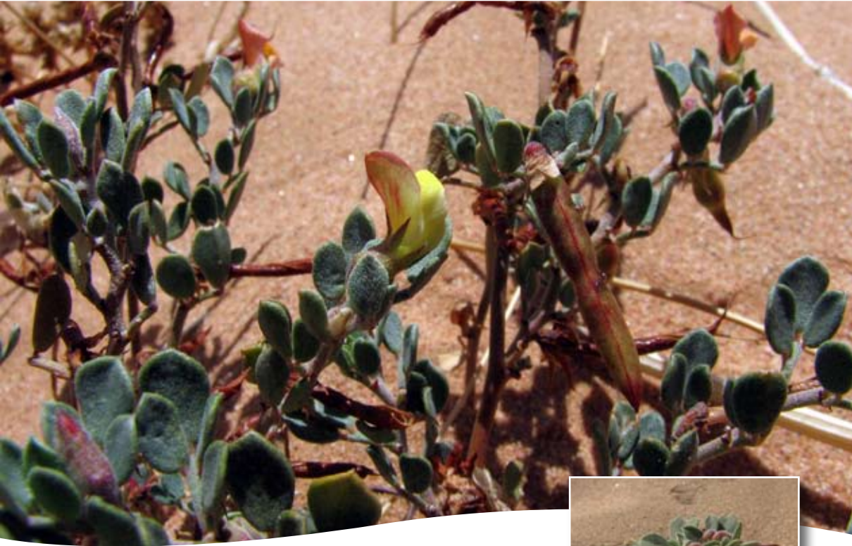
Lotus roudarei Bonnet ■