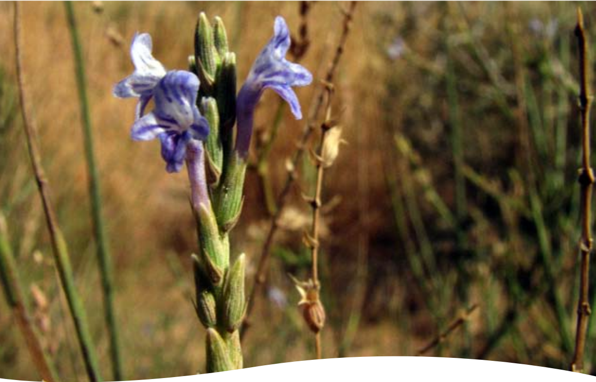
Lavandula coronopifolia Poiret ■