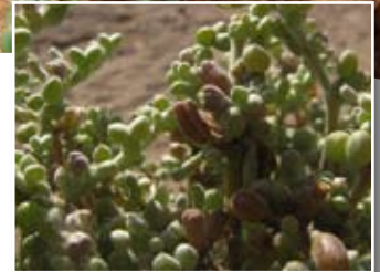
Zygophyllum gaetulum ■ subsp. waterlotii (Maire) Dobignard