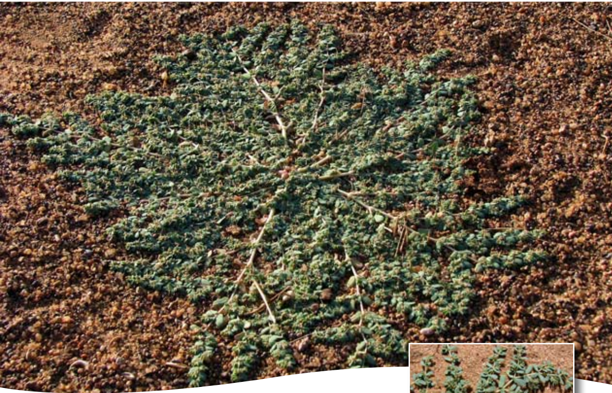
Euphorbia granulata Forssk. ■