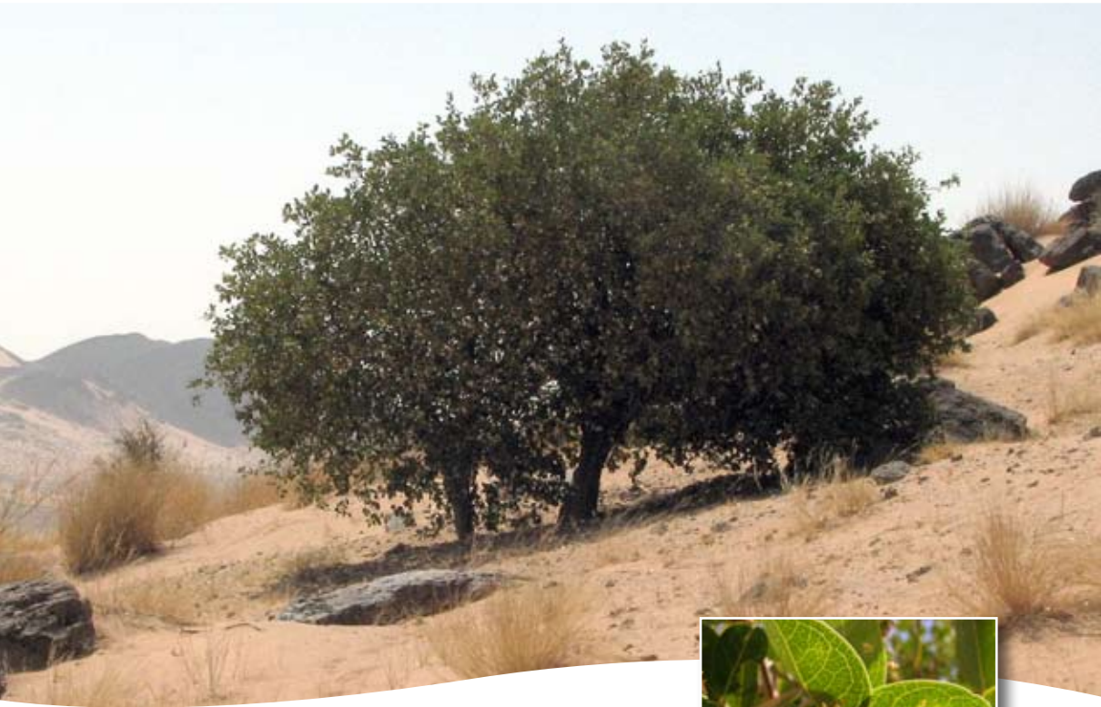
Boscia senegalensis (Pers.) Lam. ex Pour. ■