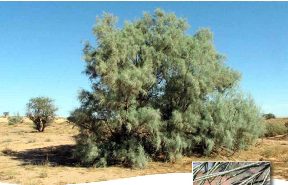
Tamarix aphylla (L.) H. Karst. ■