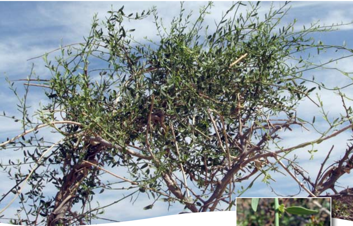
Cocculus pendulus (J. R. & G. Forst.) Diels ■