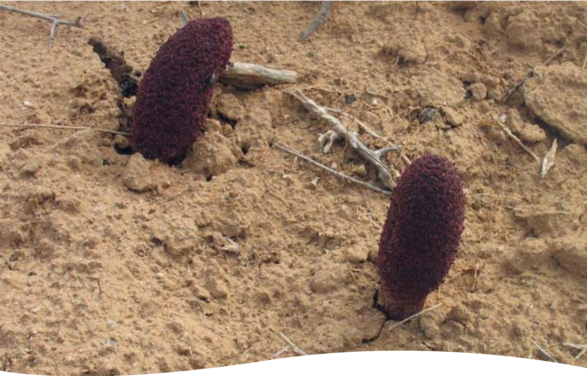
Cynomorium coccineum L. ■