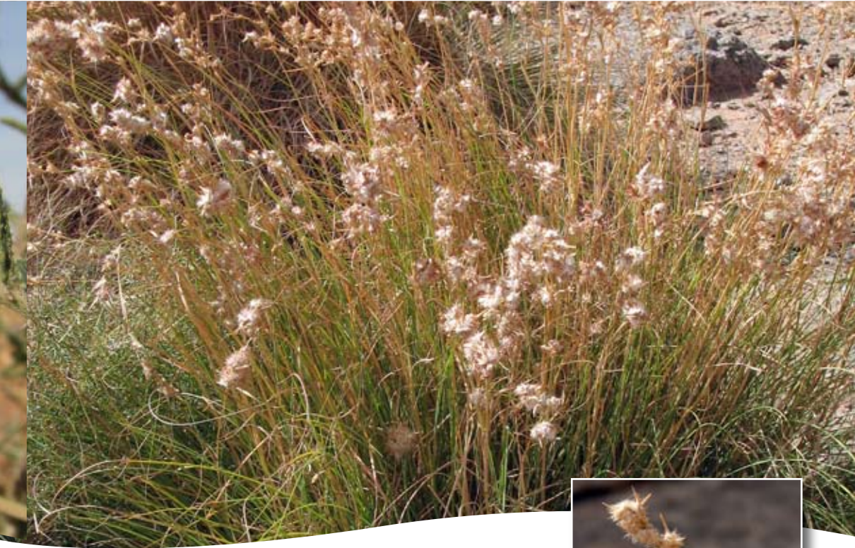
Andropogon laniger Desf. ■