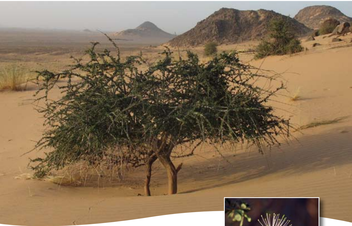
Maerua crassifolia Forssk. ■