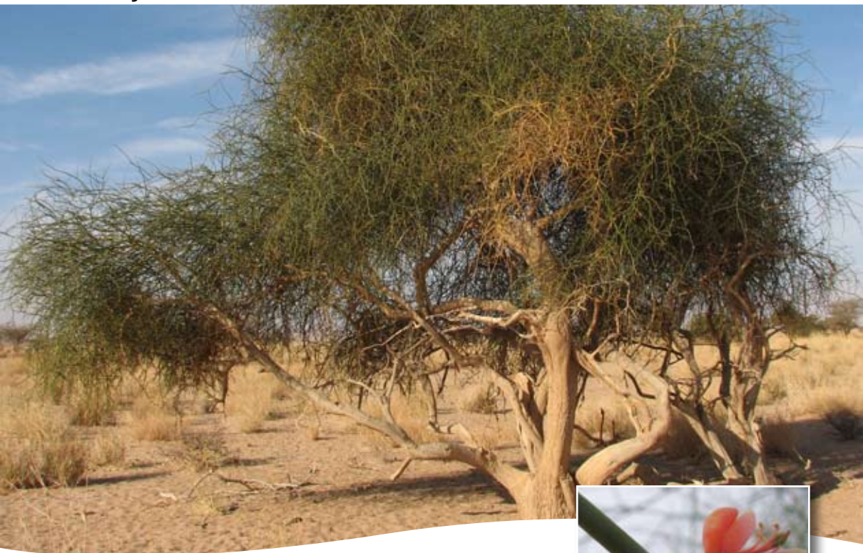
Capparis decidua (Forssk.) Edgew. ■