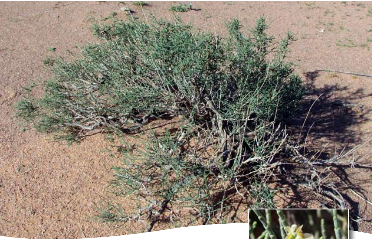
Hammada scoparia (Pomel) Iljin ■ (= Haloxylon tamariscifolium (L.) Pau)