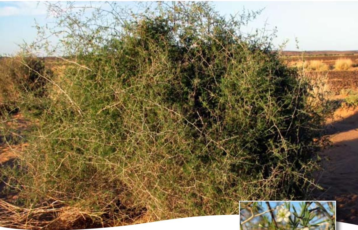
Asparagus altissimus Munby ■