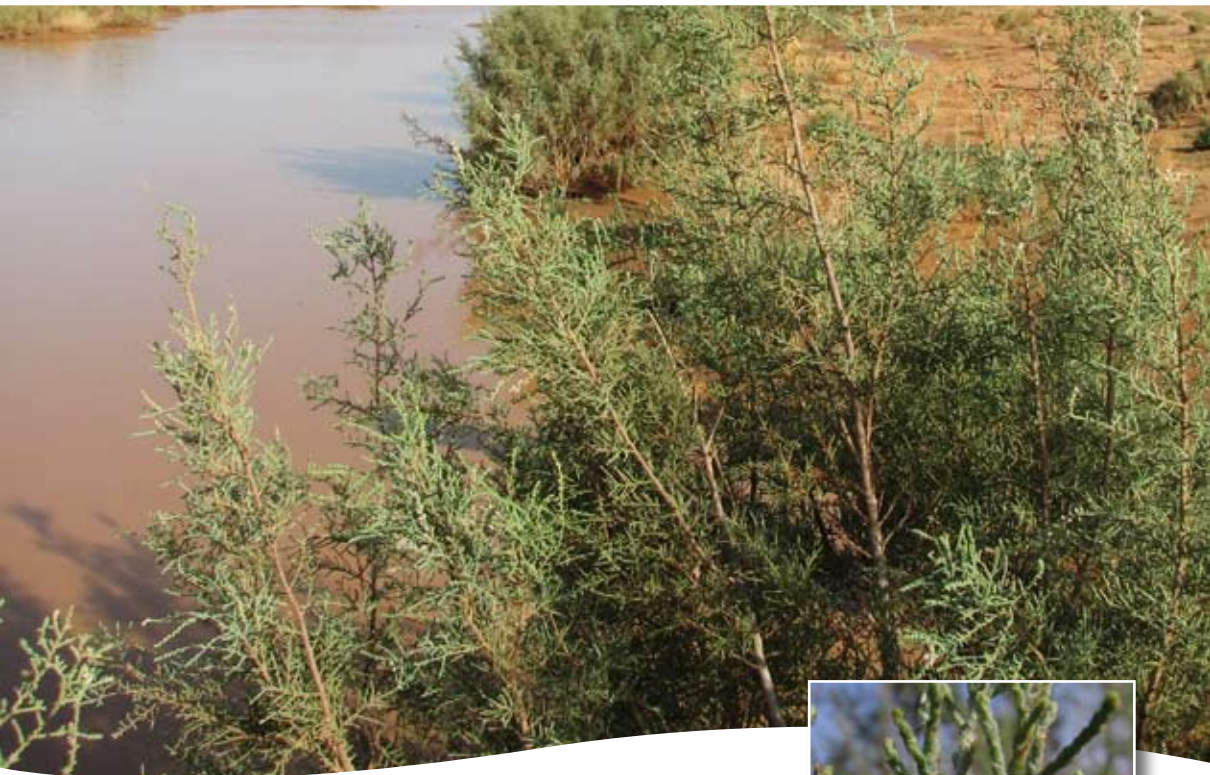
Tamarix gallica s.l. ■