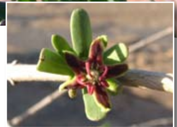
Periploca angustifolia Labill. ■ (= P. laevigata auct. et collet. non Aiton)