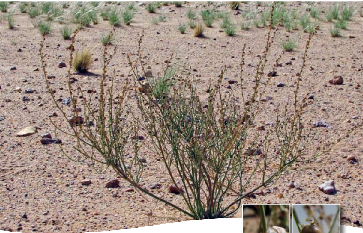
Asphodelus tenuifolius Cav. ■