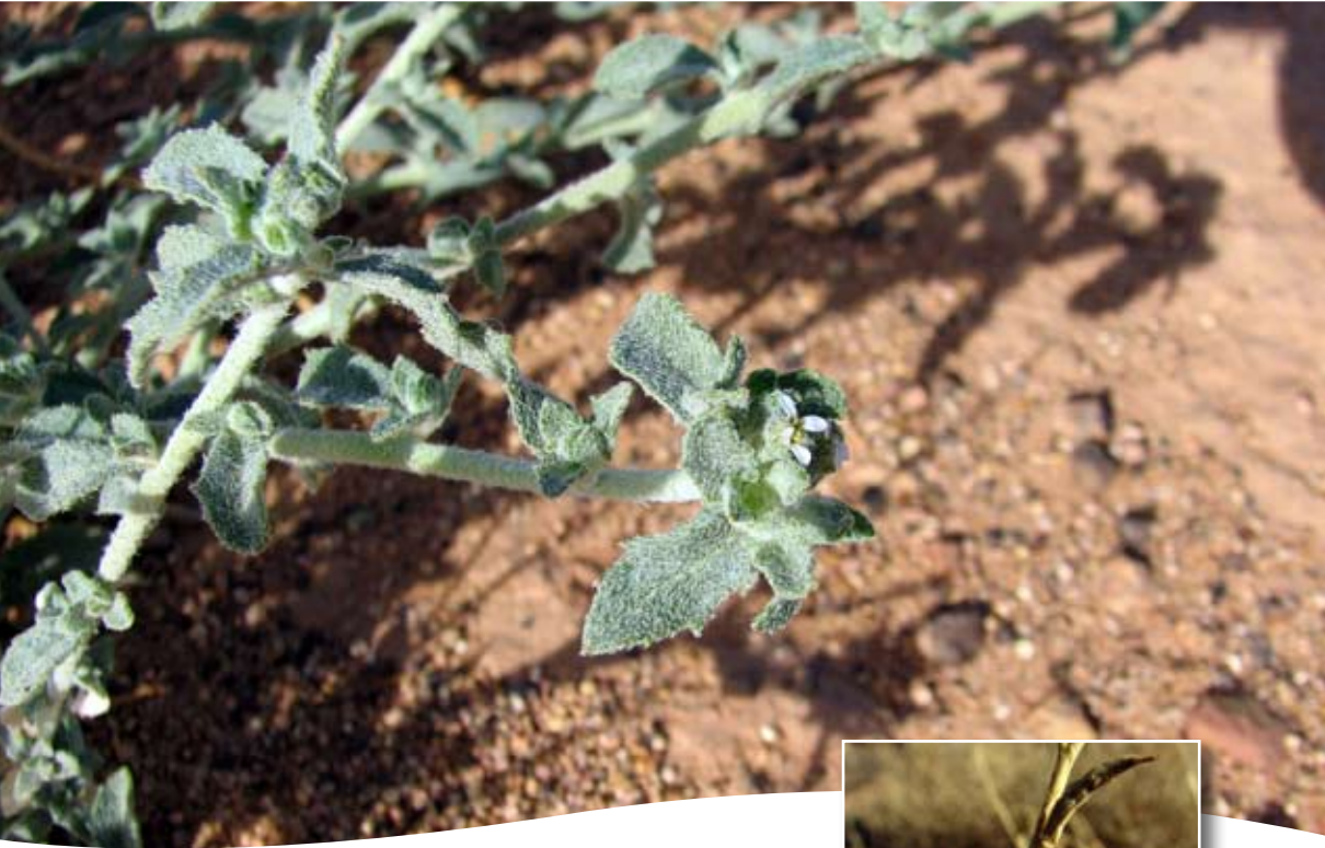
Morettia canescens Boiss. ■