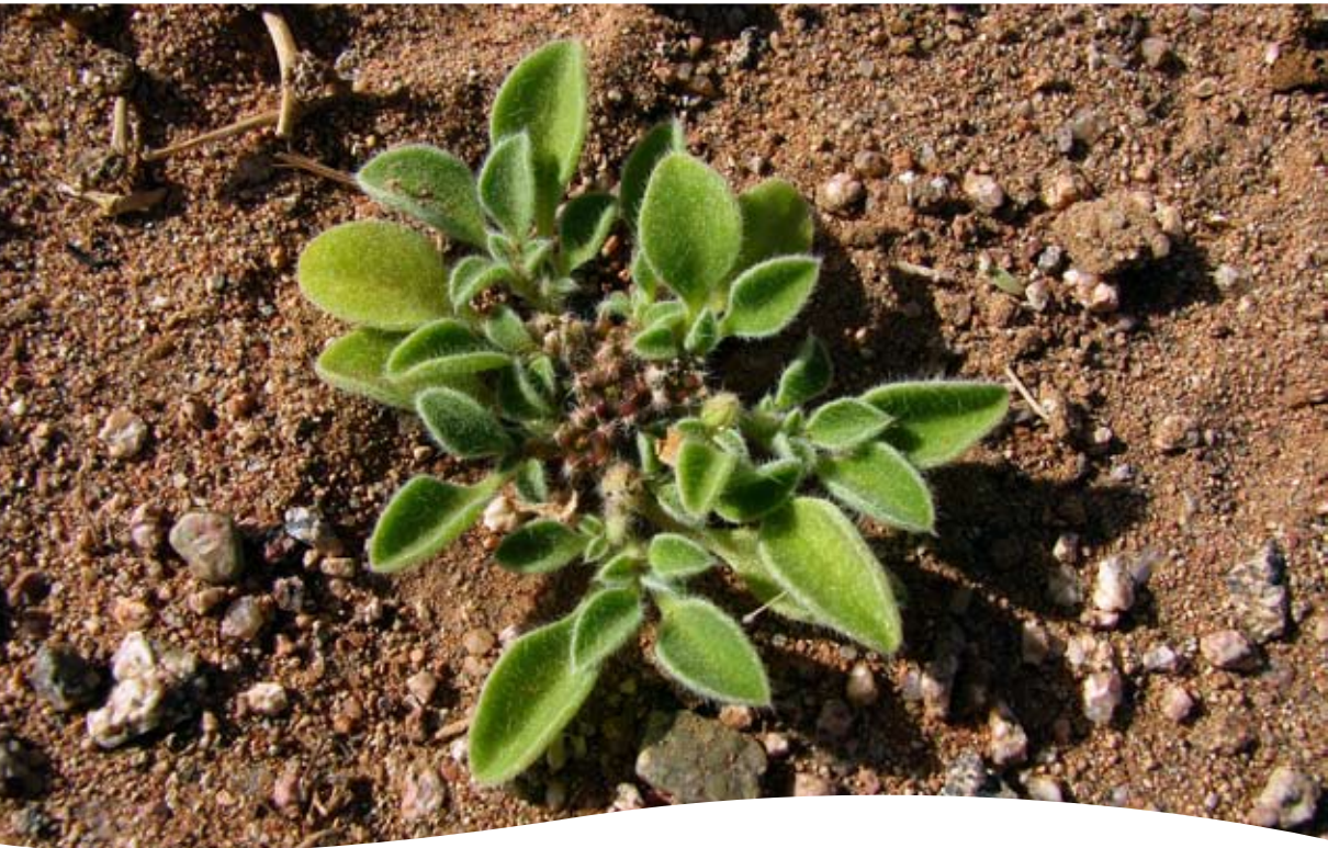
Aizoon canariense L. ■