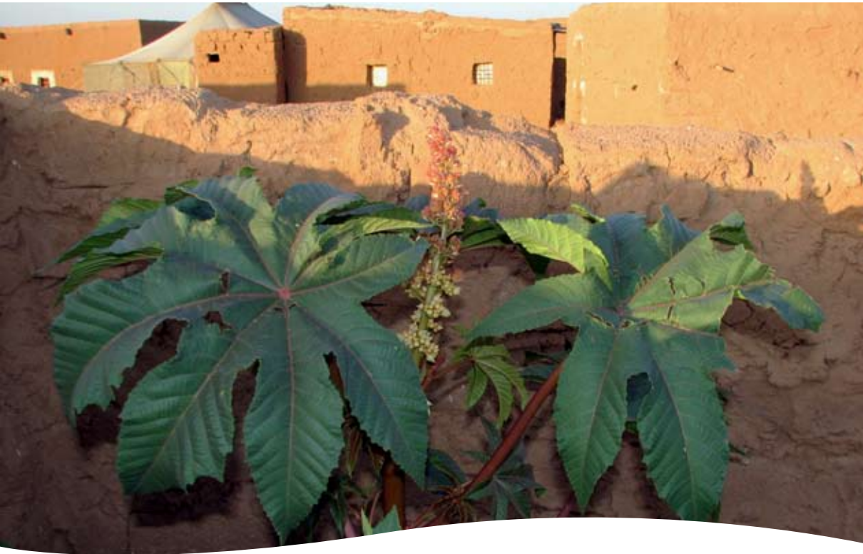
Ricinus communis L. ■