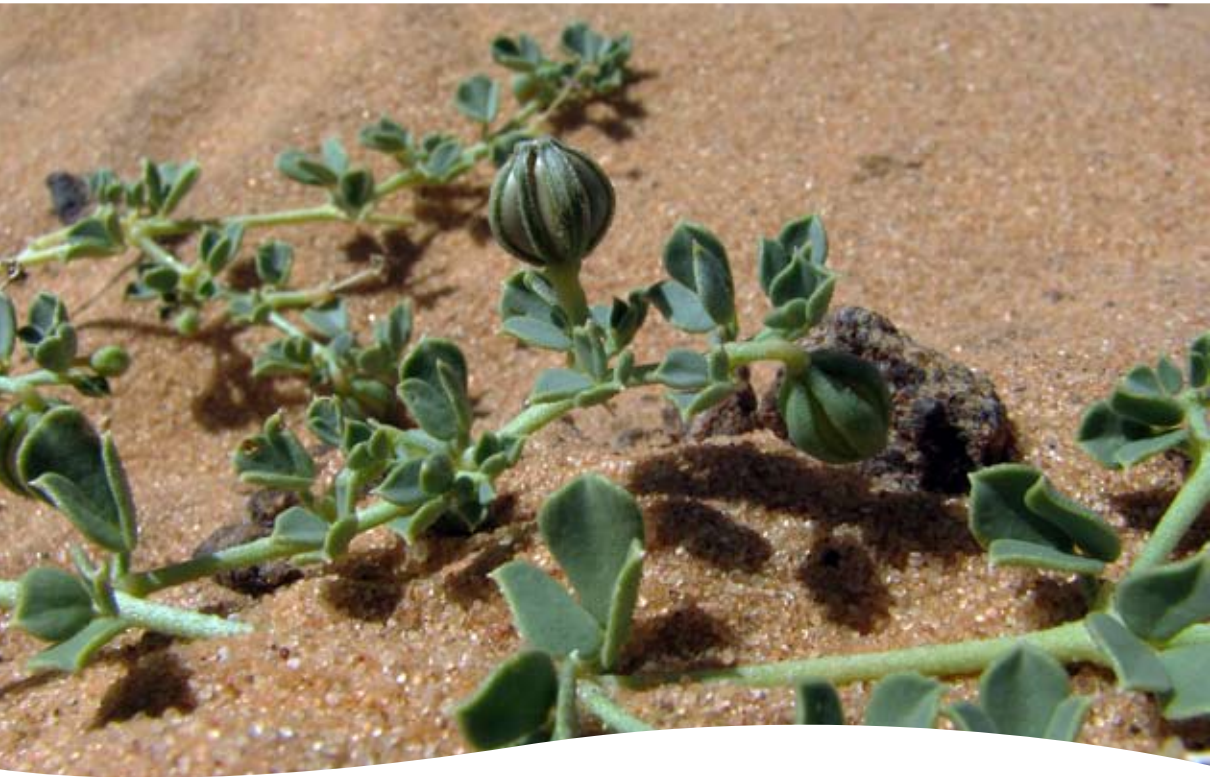
Seetzenia lanata (Willd.) Bull. (= S. africana R. Br.) ■