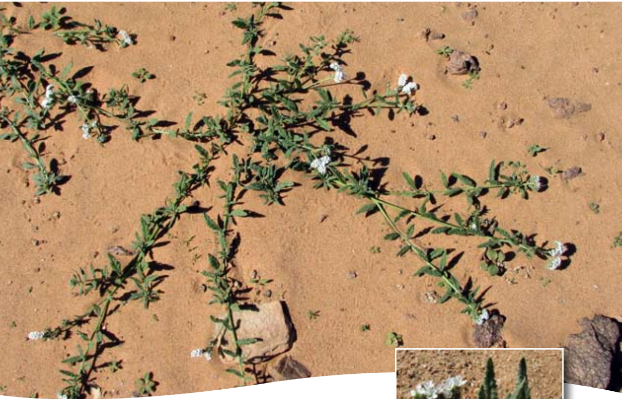
Heliotropium ramosissimum (Lehm.) DC. ■