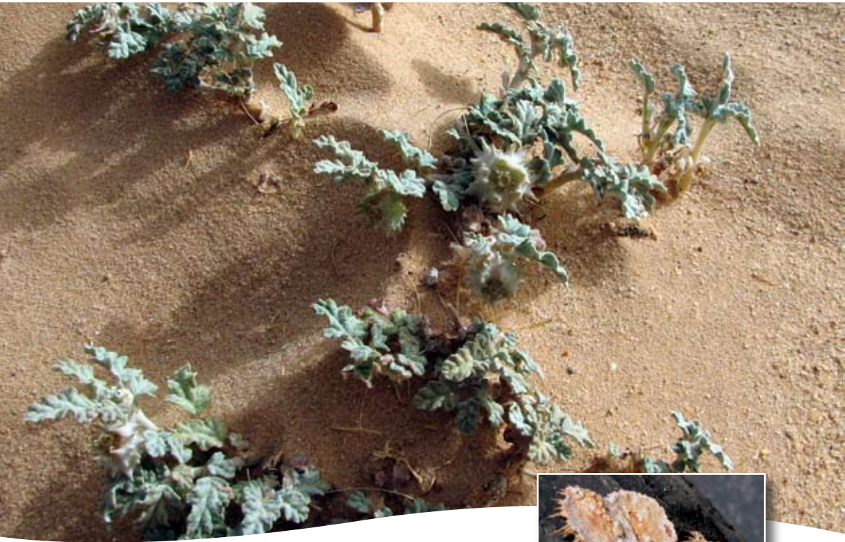
Neurada procumbens L. ■