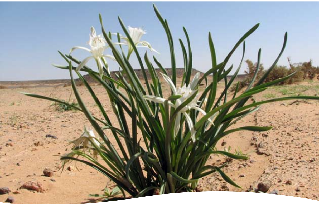
Pancratium trianthum Herb. ■