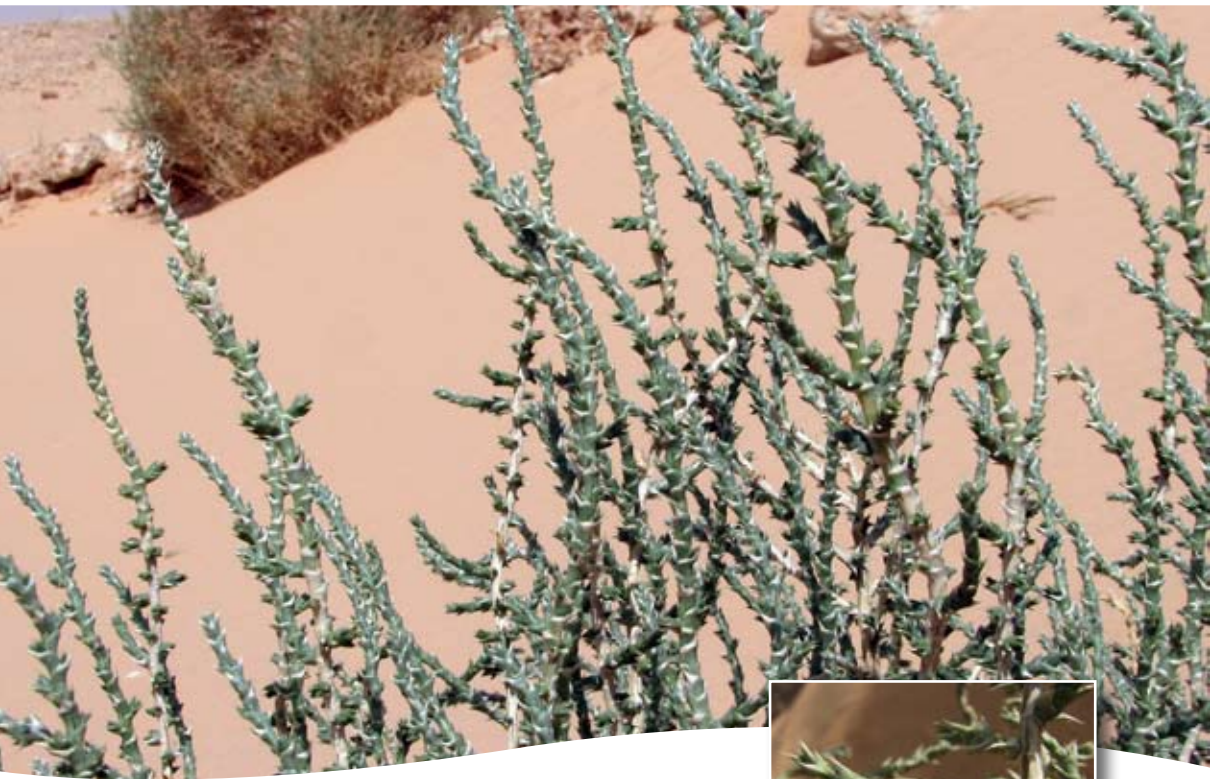
Cornulaca monacantha Del. ■