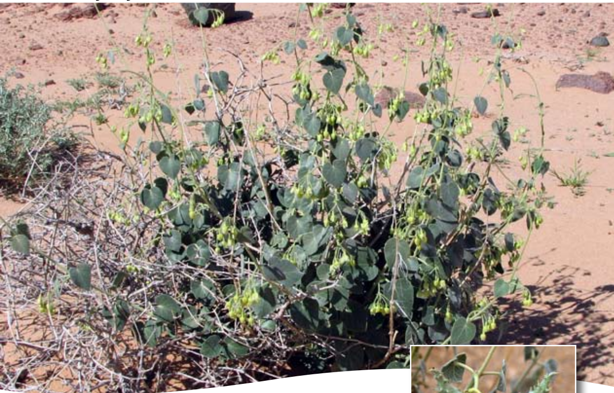
Pergularia tomentosa L. ■