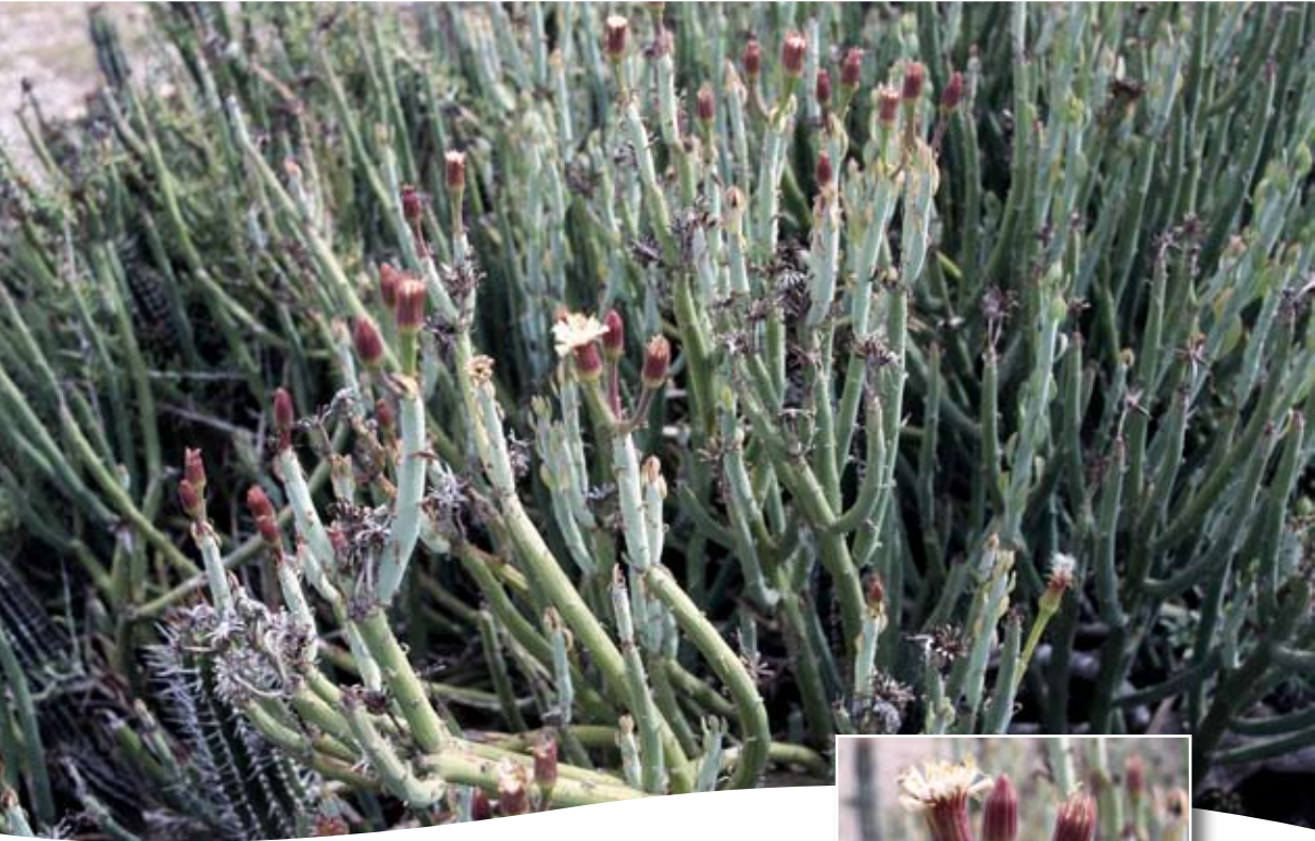
Senecio anteuphorbium (L.) Hook. fil. ■