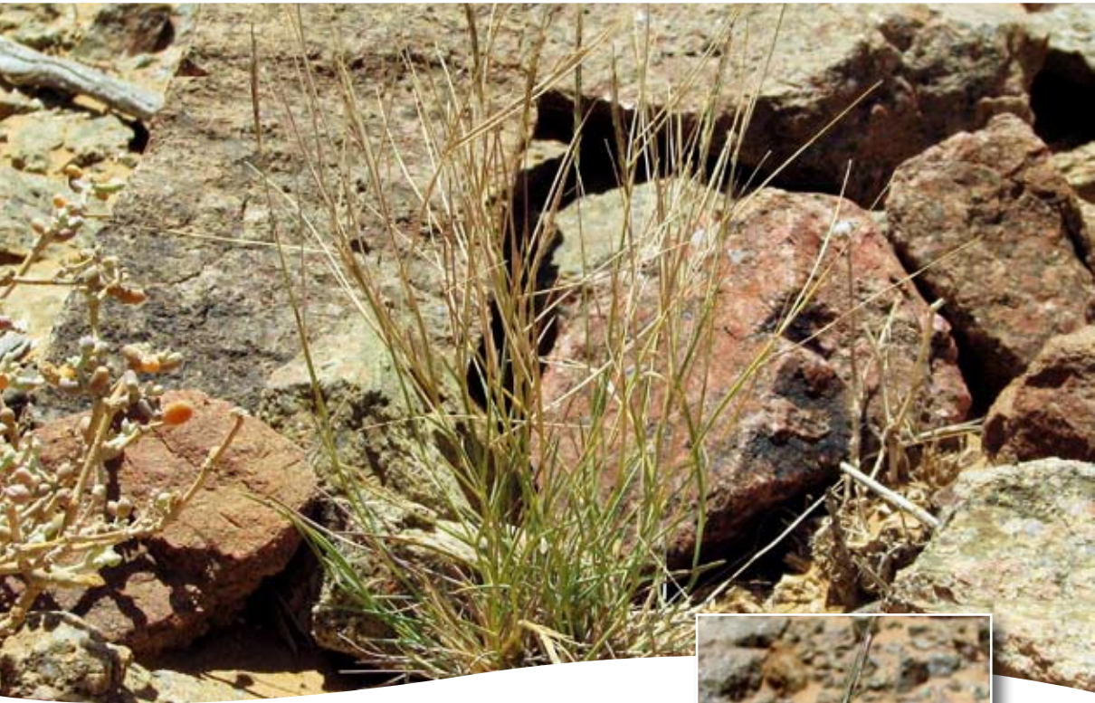
Dichantium foveolatum (Del.) Roberty ■ (= Andropogon foveolatus Del.)