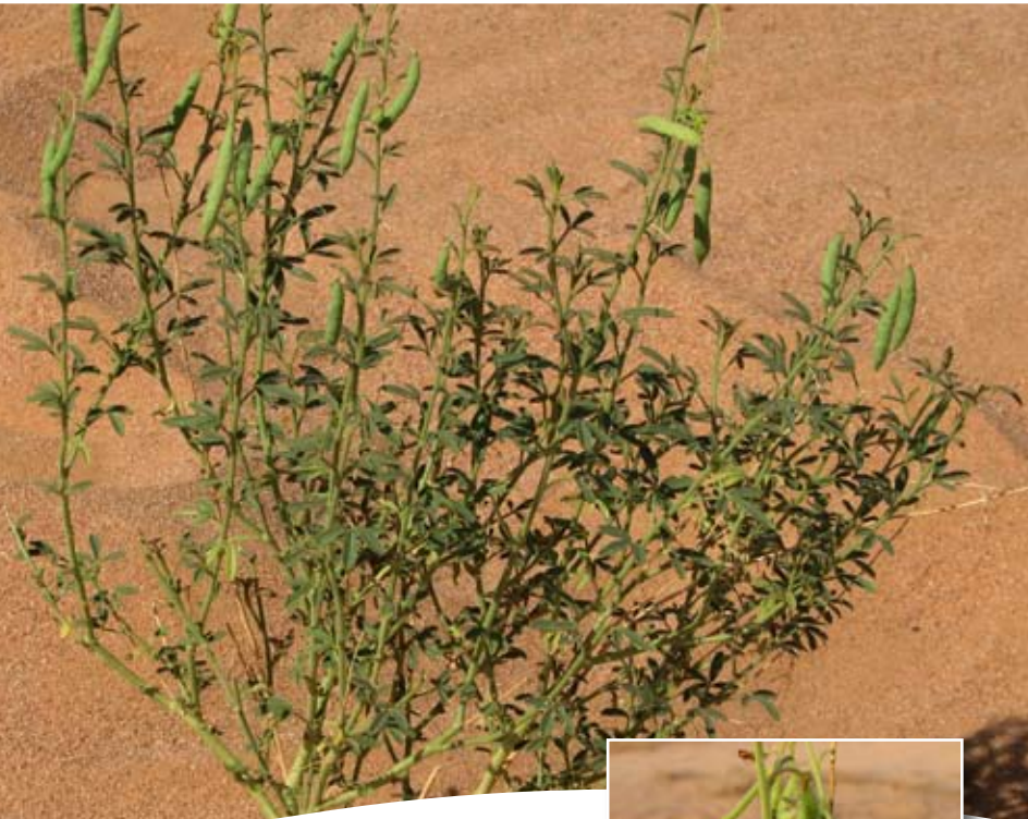
Cleome arabica L. ■