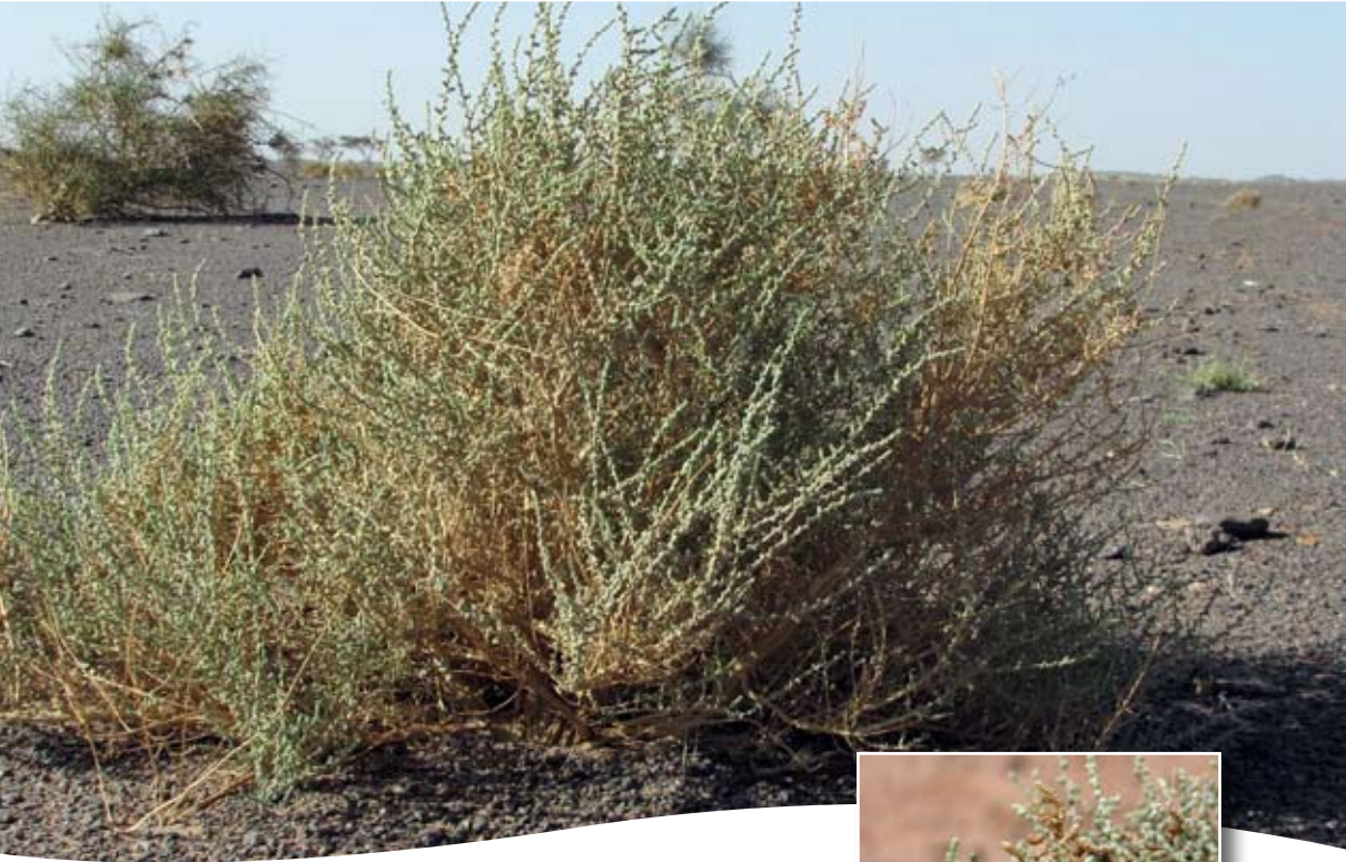
Salsola imbricata Forssk. ■ (= S. foetida Del.)