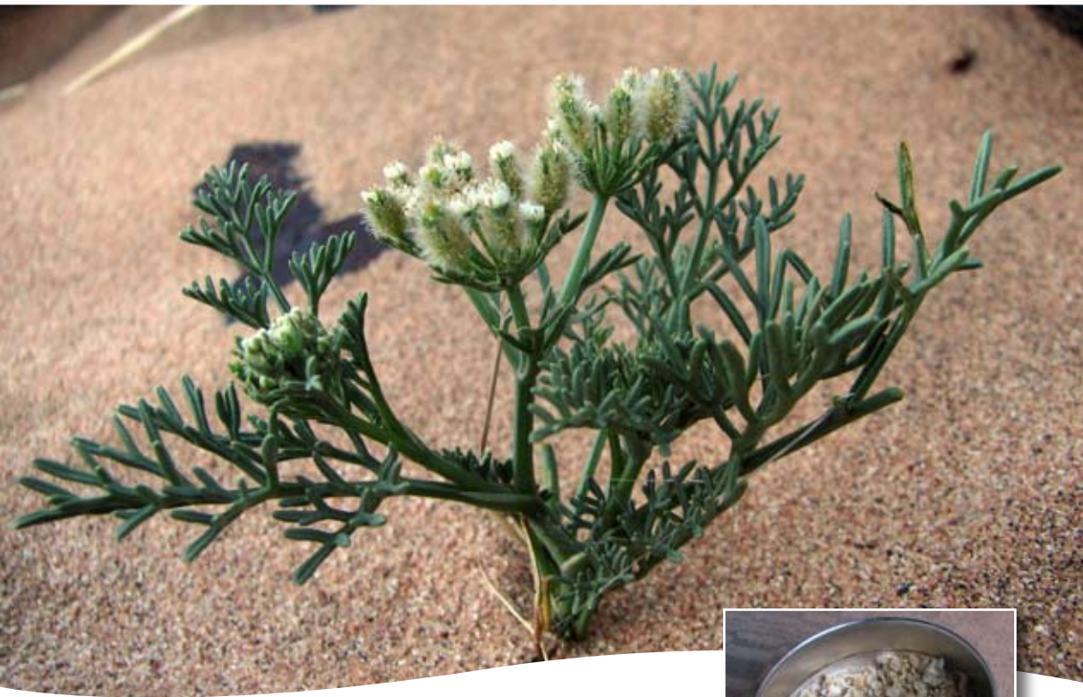
Ammodaucus leucotrichus Coss. & Dur. ■