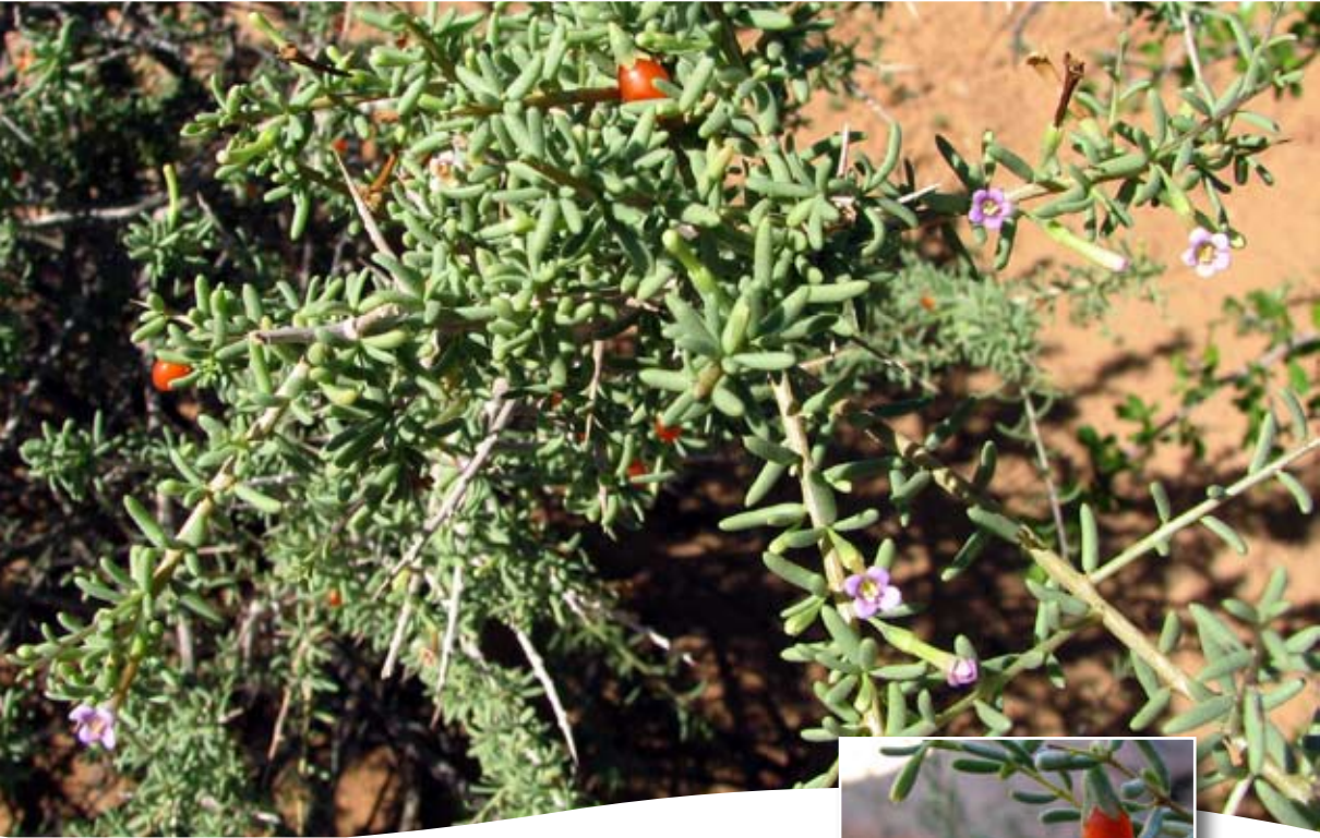
Lycium intricatum Boiss. ■